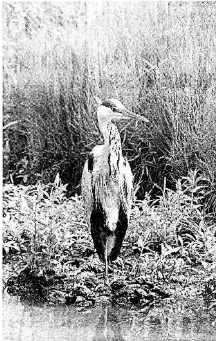
Ein leckeres Frühstück im Freien - das mögen Reihher.

ser-Agamen, die vorübergehend im Schauhaus und dem Japanischen Garten wohnen, wollen Fleisch sehen.