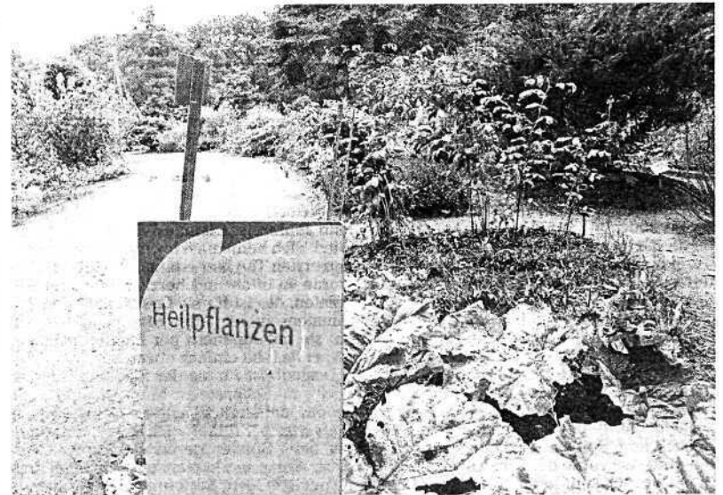
Seit 55 Jahren in Horn: Die Heilpflanzenabteilung des damals wieder eröffneten Botanischen Gartens. Die Sammlung kann sich im internationalen Vergleich sehen lassen.

> 100 Jahre Botanischer Garten: „Tag der Genera-tionen am Sonntag, 4. September, von 10 bis 18 Uhr, organisiert vom Verein der Freunde des Rhododendronparks.“