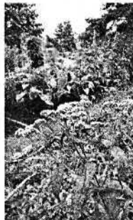
Heilpflanzen im Botani-schen Garten.

und Schlaflosigkeit. Der Tabak (lateinisch Nicotiana tabacum ) werde in der Homöopa-thie bei Durchfall, Schweißausbrüchen oder Kollaps angewendet. Sein Name geht auf den französischen Gelehrten Jean Nicot zu-rück, erklärt Maurer.